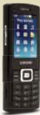
Samsung C5212 Dual SIM