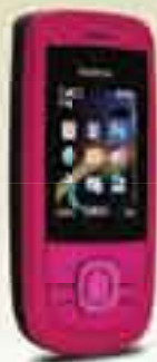
Nokia 2220 Slide Pink