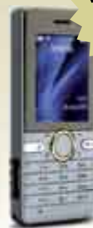
Sony Ericsson S312