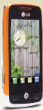
LG Cookie Fresh

Vendar so to le prehodni pojavi. Zato je dobro, da ljudje po namestitvi atlasa vodijo natančen dnevnik svojega zdravstvenega počutja in vanj vpisujejo vse spremembe, ki se pojavijo. "Iz lastnih izkušenj Tomljenovič ve, da te težave počasi izzvenijo. "Žal pa," tako pravi, "obstojajo tudi mejni primeri, ko se organizem ne more regenerirati in samoozdraviti, ker je bolezen že predolgo prisotna." ■